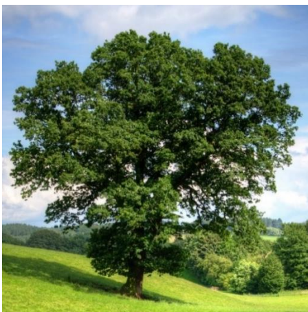
Abbildung 6