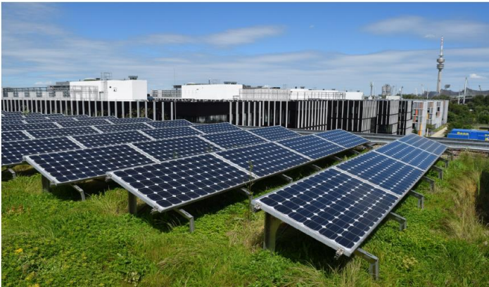
Abbildung 3 BuGG: MTZ München