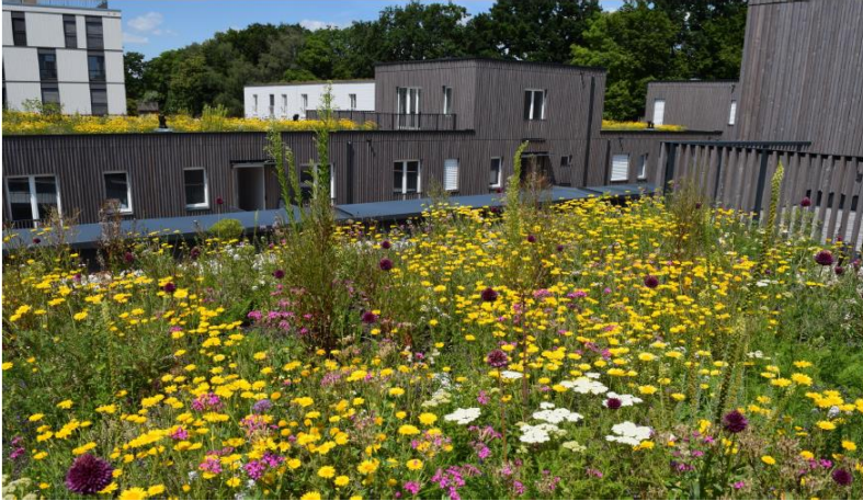
Abbildung 2 BuGG: Prinz Eugen Park München