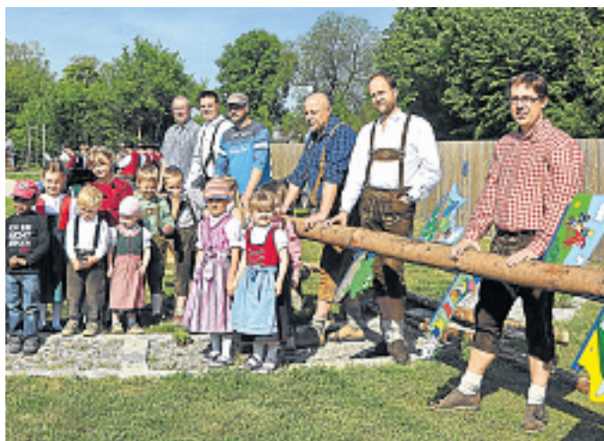
KINDERHAUS TAUSENDFÜSSLER/FOTO: TB

Mit vereinten väterlichen Kräften wurde im AWO-Kinderhaus „Tausendfüßler“ ein neuer Maibaum aufgestellt. Unterstützt von Bürgermeister Hans Seidl fand die 15 Meter hohe Fichte aus dem Wald bei Unterlappach im neuen Gartenbereich ihren Platz. Anschließend feierten die 85 AWO-Kinder mit ihren Eltern und Erziehern bei Blasmusik und Leberkäs ein rundum gelungenes Maifest. KINDERHAUS TAUSENDFÜSSLER/FOTO: TB