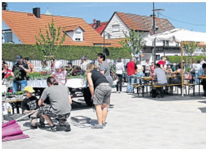
OGV MAISACH/FOTO: TB

Vor kurzem veranstaltete der Obst- und Gartenbauverein Maisach einen Pflanzenmarkt am Platz vor dem Rathaus. Bei schönstem Wetter kamen zahlreiche Käufer und auch Verkäufer zum Marktplatz. Dort konnten alle Interessierten Pflänzchen wie Tomaten, Gurken, Zucchini und vieles mehr erwerben. Bei Kaffee und selbstgebackenen Kuchen wurde der Nachmittag abgerundet. OGV MAISACH/FOTO: TB