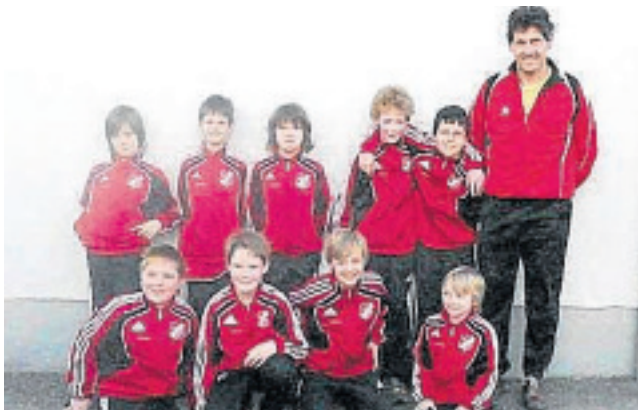
STOCKSCHÜTZEN WEISS-BLAU GERMERSWANG

Toll in weiß-rot Die E-Junoren von Rot-Weiß Überacker bedanken sich bei einem Sponsor für die weiß-rotten Trainingsanzüge der Fa. Cadelan aus München. Hoffentlich bringen die Anzüge uns viel Glück und viele Siege.