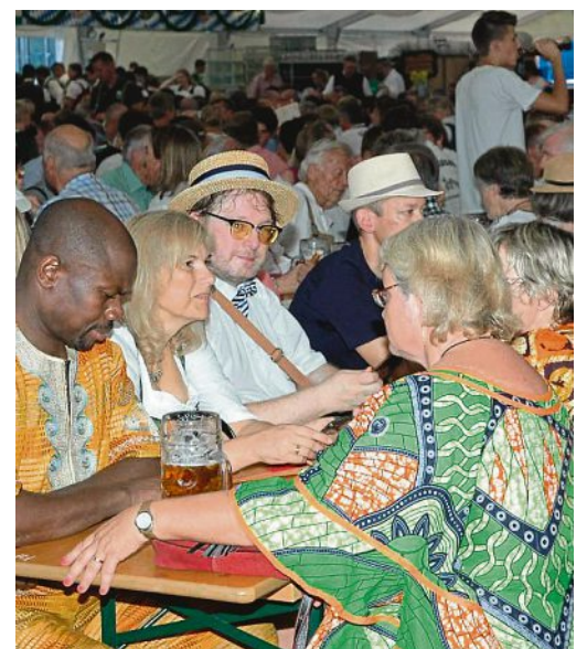
Dass die Festwoche bunt und stimmungsvoll ist, wird jeden Tag bewiesen.