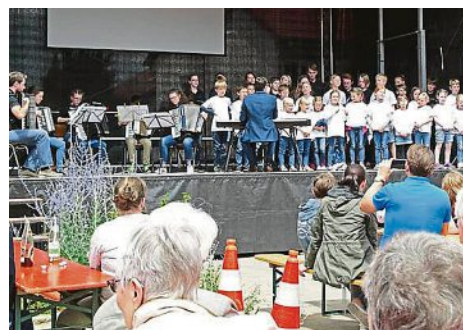
GESANGVEREIN MAISACH