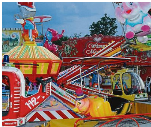
Auch in den Abendstunden locken die Schausteller die Festbesucher zahlreich an.