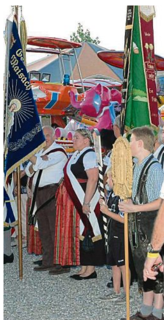
Stets farbenfroh ist der Einzug der vielen Ortsvereine.