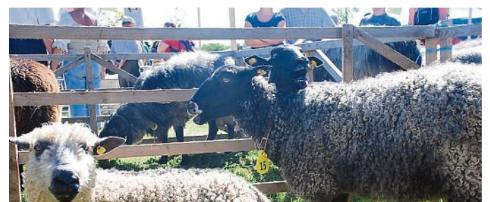
Alles rund um's Schaf sowie eine Kleintierschau gibt es am ersten Sonntag der Maisacher Festwoche