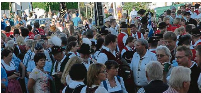
Das Platzkonzert vor dem Rathaus ist traditionell erster Anziehungspunkt, bevor die Festwoche eröffnet wird.