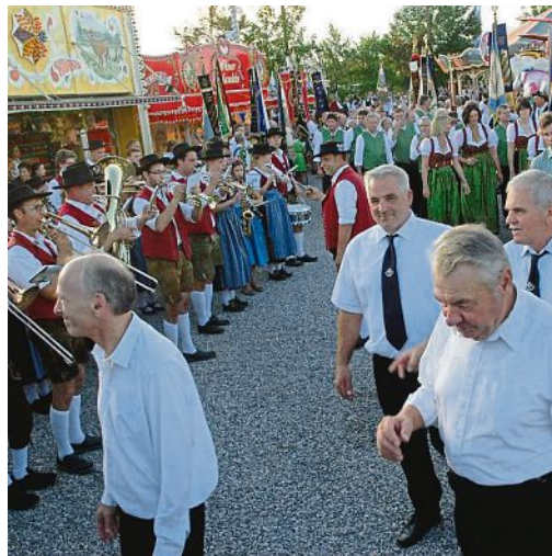
Geschafft: Beim Einzug gibt der Platz unmittelbar vor dem Festzelt ein stimmungsvolles Bild ab.

Damit Sie sicher heimkommen: Ruf - Taxi (Telefon: 089/84005811) Taxi-Stand am Festplatz: Taxi Werner (Telefon: 08141/20102)