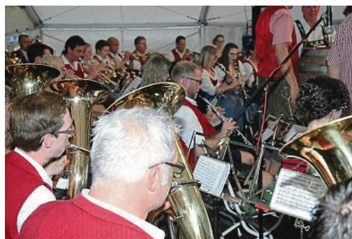
Die Blaskapelle Maisach spielt wie immer zum Anfang zünftig auf.