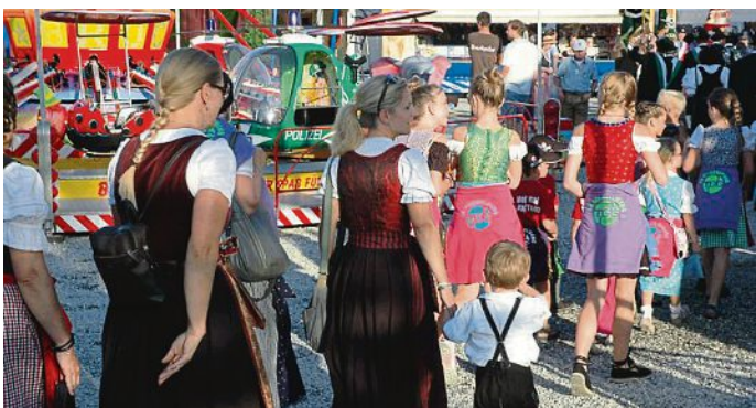
Alle Schausteller tragen ebenfalls dazu bei, das die Maisacher Festwoche ein Anziehungspunkt für Jung und Alt ist.