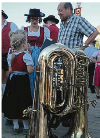
A zünftige Blasmusik gehört zur Festwoche einfach dazu.