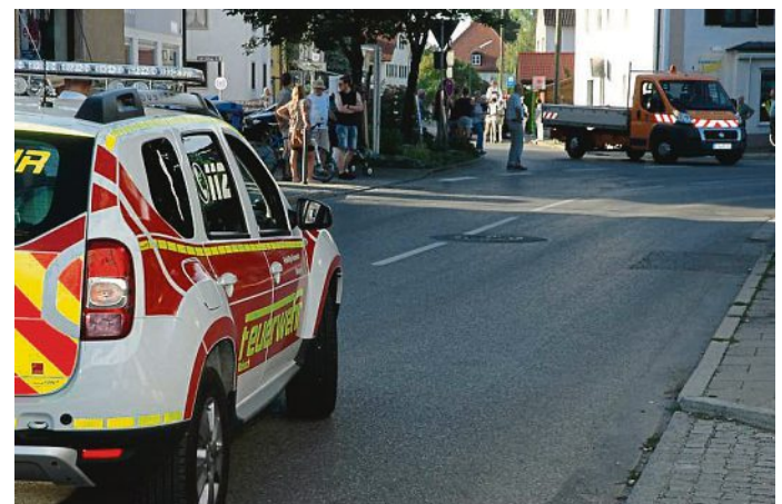
Für die Sicherheit während des Festumzuges sorgen Freiwillige Feuerwehr und Mitarbeiter des Bauhofes.