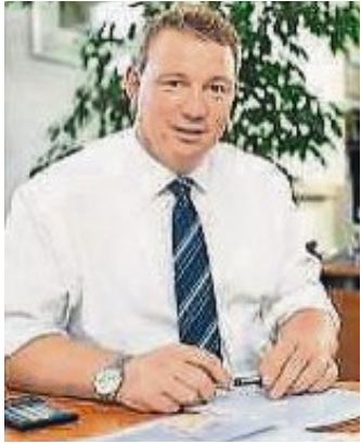
Liebe Mitbürgerinnen und Mitbürger,

der Monat Dezember ist nicht nur die vorweihnachtliche Zeit, sondern auch die Zeit der Jahresabschlüsse und Haushaltsberatungen in den Gemeinden. Am 1. Dezember wurden den Gemeinderäten erstmals das Rechenergebnis 2016 und der neue Finanzplan für 2017 bis 2020 vorgelegt.