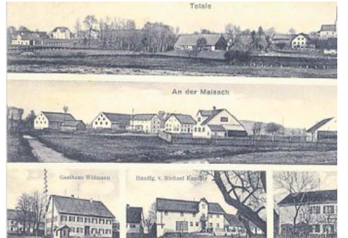
Überacker in verschiedenen Ansichten um 1935, rechts unten das Schulhaus, welches bald ebenfalls Geschichte sein wird. Die Postkarte wurde im Handel für das Gemeindearchiv erworben.