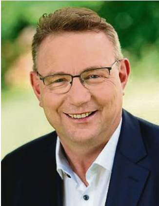
Liebe Mitbürgerinnen und Mitbürger,

in den letzten Wochen und Monaten sind Ihre finanziellen Belastungen stetig gewachsen, sei es beim Einkaufen oder bei der Freizeitgestaltung. Auch verheißt Post des Strom- oder Gaslieferanten in der Regel immer höhere Kosten.