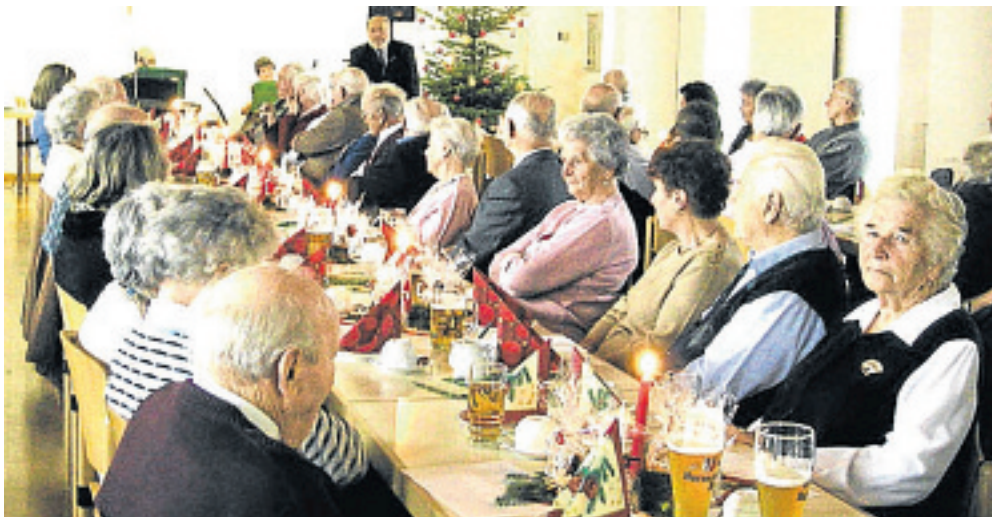
KINDERHAUS ST. BARTHOLOMÄUS