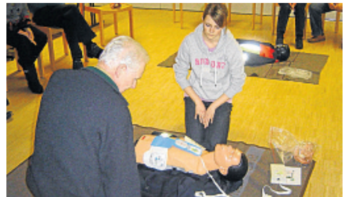
Der Umgang mit einem Defibrillator will gelernt sein.

Ein AED dient der primären Behandlung von Herzrhythmusstörungen, wie sie beispielsweise beim Krankheitsbild des plötzlichen Herztodes oder nach einem schweren Herzinfarkt vorkommen. FFW GERNLINDEN