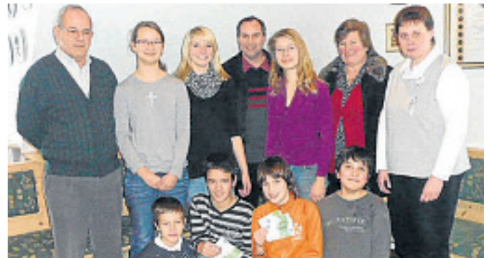
Fast 2000 Euro spendeten die Sternsinger.