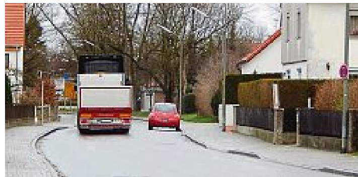
der Kommunalen Verkehrsüberwachung kontrolliert und geahndet.

Das Halteverbot in der Überackerstraße wurde vor einigen Tagen montiert. Aufgrund mehrerer parkender Fahrzeuge auf der Straße ist es zu unübersichtlichen Situationen und teilweise Gefährdungen gekommen. Der Gemeinderat hat das absolute Halteverbot auf Drängen mehrerer Bürger beschlossen, nachdem der gemeindliche Aufruf nach einer freiwilligen Reduzierung des Parkens der Straße nicht funktionierte. Das Parkverbot wird von