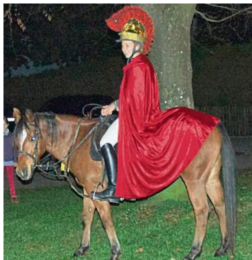
KINDERGARTEN BRUDER KONRAD

Der Kindergarten Bruder Konrad lud Groß und Klein zum Laternenumzug ein. Um 17 Uhr ging es endlich los. Der Fanfarenzug spielte auf und die Kinder zogen Hand in Hand mit ihren Erzieherinnen in die Kirche ein. Dort versammelten sich die Kleinen um den Altar und sangen uns die schönsten Martinslieder vor. Dieses Jahr spielten drei talentierte Kinder das Martinsstück und erinnerten uns so an die Zeit des Teilens. Durch den Fanfarenzug Gernlinden musikalisch unterstützt, marschierten Kinder mit den schönen, selbstgebastelten Laternen und Erwachsene singend in Richtung Schlittenberg, allen voran der heilige Martin zu Pferde.