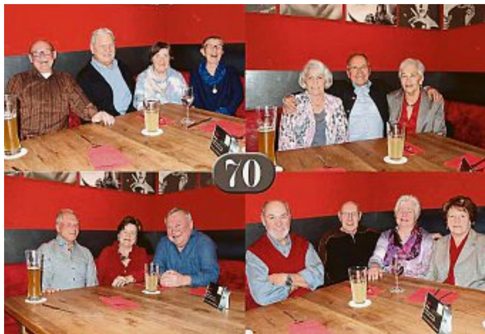
GERD WÜRFEL/FOTO: TB

Zum Klassentreffen des Jahrgangs 1945 gab es ein Wiedersehen der ehemaligen Schüler in Gernlinden. Vor 64 Jahren waren sie „Erstklässler“. Heute können sie auf siebzig Lebensjahre zurückblicken. Da gab es viel zu reden, über Vergangenes und Gegenwärtiges, aber auch über die Vorhaben in der Zukunft. In fünf Jahren will man sich wieder treffen.