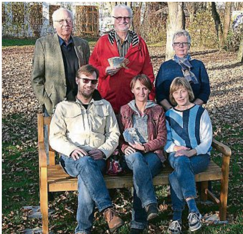
PFARREI ST. VITUS

bis 5. Januar wünschen, melden Sie dies bitte bis spätestens 31. Dezember im Pfarrbüro an (Telefon 08141/39080 oder unter E-Mail: pv-maisach@ebmuc.de)