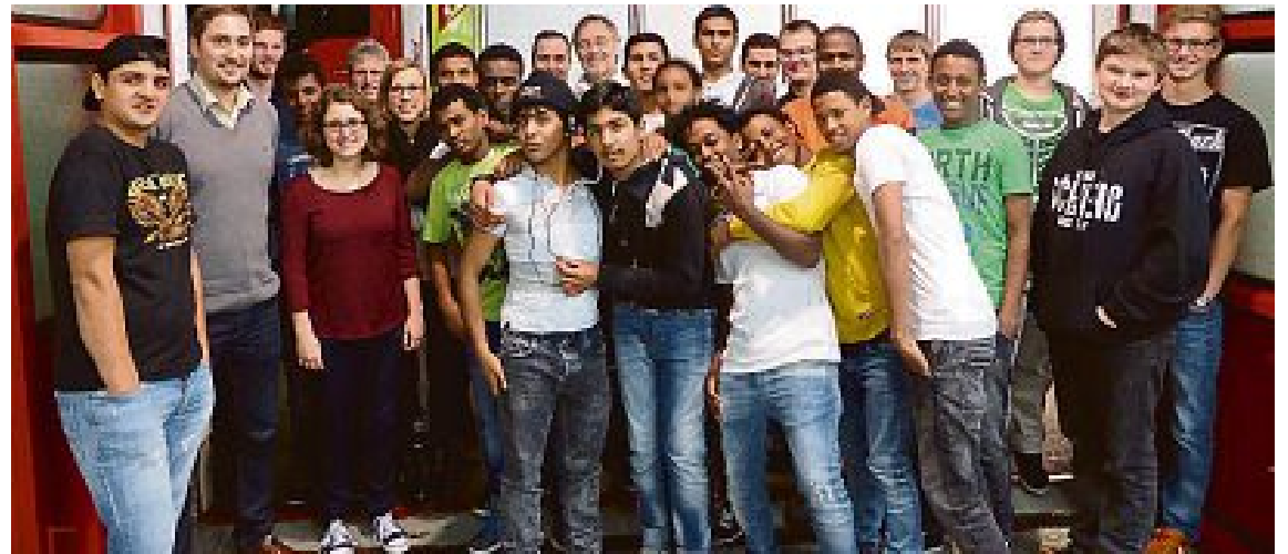
FREIWILLIGE FEUERWEHR GERNLINDEN/FOTO: TB

Kennenlernabend Am Freitagabend, 20. November, nutzten rund 15 Jugendliche aus der Asylbewerberunterkunft in der Rudolf-Diesel-Straße die Chance, sich das Thema Feuerwehr im Gerätehaus der Feuerwehr Gernlinden genauer erklären zu lassen. Im Laufe des Abends wurden verschiedene Stationen rund um die Feuerwehr durchlaufen. Unter anderem waren darunter Löschübungen, Erste Hilfe sowie verschiedene Einsatzgerätschaften. Ziel sollte sein, nebenbei auch ein Verständnis für die Abläufe beim Auslösen der Brandmeldeanlage in der Unterkunft der unbegleiteten Jugendlichen zu vermitteln. Der Abend hat allen Beteiligten sehr viel Spaß bereitet. Als Abschluss gab es eine gemeinsame Brotzeit mit den Feuerwehrkameradinnen und -kameraden aus Gernlinden sowie ein Kickerturnier mit gemischten Teams.