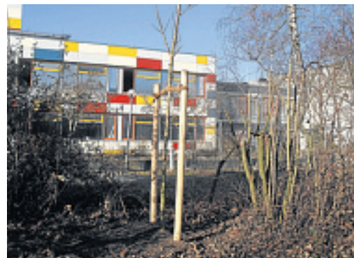
Arbeiten im Bereich der Realschule. FOTO: TB