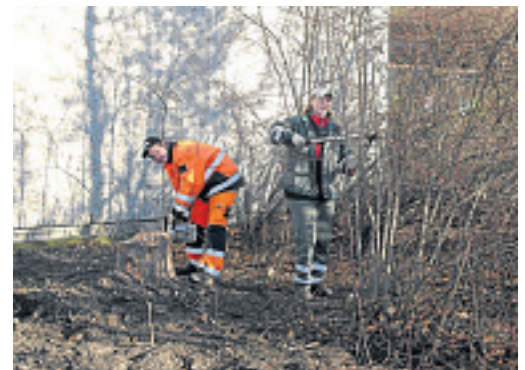
Sicht verbessert bei der Hauptschule.