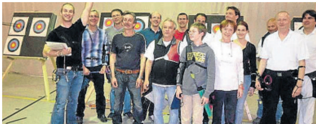
BSC MAISACH

auf Platz vier gearbeitet und vor die Landkreisevereine Olching und Puchheim gesetzt. Sowohl die BSC Maisach Hobby- als auch Turnierschützen haben Freude an der Entwicklung von Ausdauer, Geduld und Konzentration. Jung und Alt können es auch ausprobieren. Schauen Sie im Training vorbei: samstags in der Grundschule Maisach von 13 bis 18 Uhr. Weitere Infos: www.BSC-Maisach.de