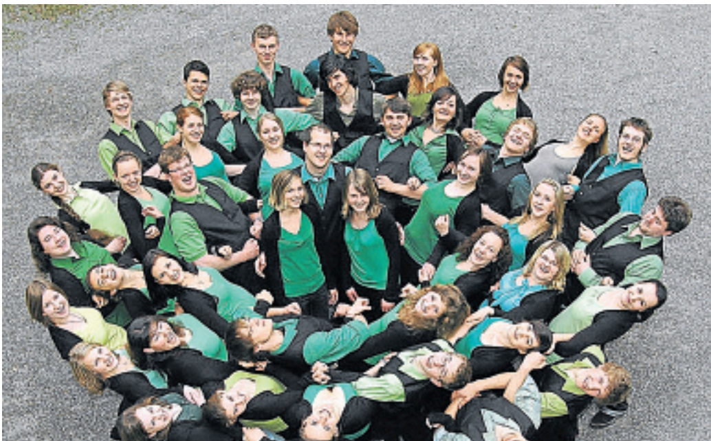
Der bayerische Sängerbund tritt in der Pfarrkirche St. Vitus auf.