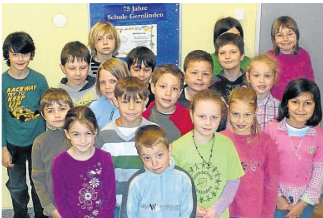
Auch die Klasse 2 a feiert das Jubiläum der Gernlindner Grundschule.