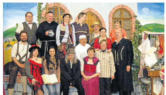
Die Theatergruppe des SC Maisach begeisterte.