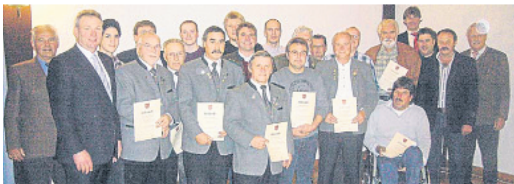
Von der Schützengesellschaft Bavaria Maisach wurden 19 erfolgreiche Schützen geehrt.