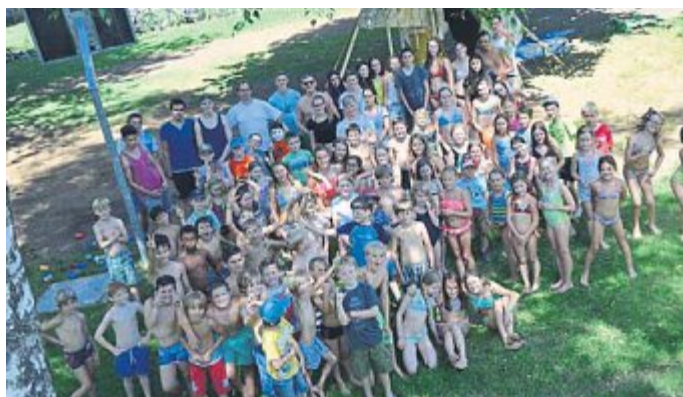
Ferierspielwoche Gernlinden: Jede Menge Erlebnisse und noch mehr Spaß gab es für alle Teilnehmer.