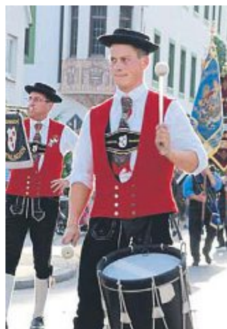
Am Festzug beteiligten sich die Vereine zahlreich.

Ganz besonders auch unserer Verwaltung im Rathaus und dem