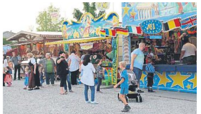
Schaustellern und Besuchern der Maisacher Festwoche gilt wieder der Dank der Gemeinde.