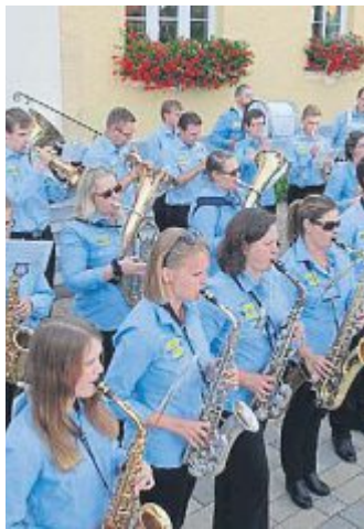
Das Standkonzert fand zu Beginn am Rathaus statt.

Am Donnerstag beim Tag der Betriebe und Behörden sorgte in