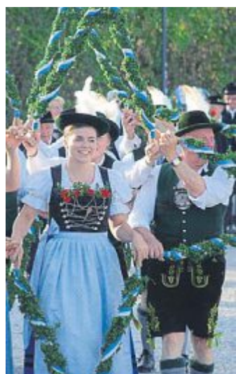
Tradition wird bei der Festwoche gut gepflegt.