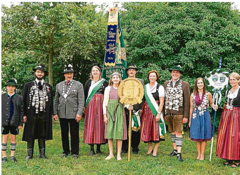
Die Schützenkönige bei der Festwoche

Der derzeitige Mitgliederstand bei den Bavaria-Schützen beträgt 364, dazu kommen noch 72 Zweitmitglieder. SG Bavaria Maisach